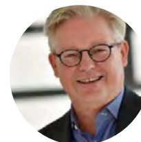
pierre de vos